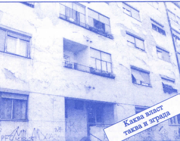
Каква власт таква и зграда

Према плану Општинског одбора Српске радикалне странке Палилуле, начињене су смернице асфалтирања и санирања коловоза, ударних рупа, израда и поправка тротоара, као и постављање саобраћајних знакова на територијама свих месних заједница.