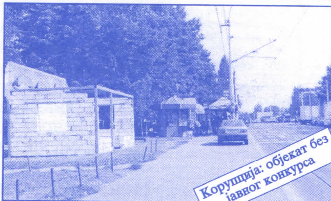
Корупција: објекат без јавног конкурса

Општина ће помоћи социјално најугроженије становнике Палилуле. Та помоћ ће имати једнократни карактер. Примат у оваквим акцијама имаће деца без родитеља, деца палих бораца, инвалиди последњег рата, стари грађани и физички хендикепирана лица. Организовање овакве помоћи биће обављено путем конкурса објављеног у општинским новинама (или другим средствима јавног информисања) на који ће моћи да се пријаве сви грађани општине Палилуле.