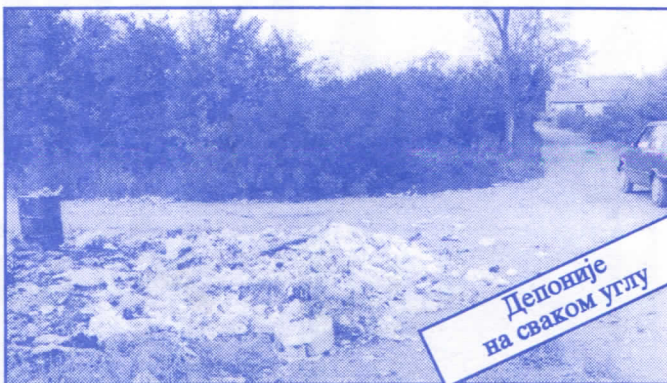
Депоније на сваком углу

Заложићемо се за пројектовање и изградњу канализације за кишне и отпадне воде у сеоским насељима, очистићемо колекторе, умањићемо опасност од бујица и активирања клизишта. У градском делу Палилуле решићемо проблем атмосферских вода које при изградњи новијих објеката нису каналисане те у време киша угрожавају сутерене и подруме околних зграда.