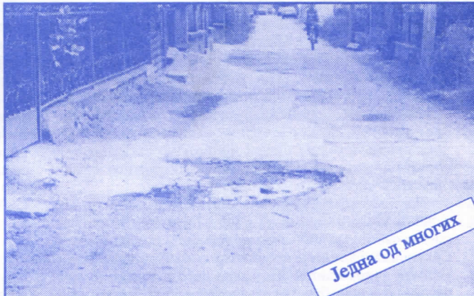
Једна од многих

Подржаваћемо донаторство и спонзорство као вид помагања културним установама. Покренућемо отварање нових огранака библиотеке и обезбедити простор за њих (евентуално просторије месних заједница). Обновићемо домове културе у свим приградским насељима.