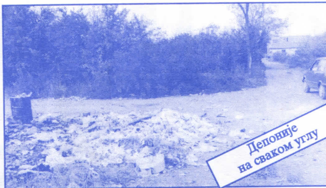
Деловије на сваком углу

• Оснивач и издавач: др Војислав Шешељ • Издање приредио: Општински одбор Српске радикалне странке Палилуле • Главни и одговорни уредник: Синиша Аксентијевић • Заменик главног и одговорног уредника: Душан Весић • Помоћник главног и одговорног уредника: Јасна Олујић Радовановић • Техничко уређење и компјутерски прелом: Бранка Бобић и Саша Радовановић • Лектор: Зорица Илић • Редакција: Момир Марковић, Наташа Јовановић, Јадранка Шешељ, Јана Живаљевић, Александар Вучић, Драгољуб Стаменковић, Весна Арсић, Коста Димитријевић, Вељко Дукић, Весна Марић • Секретар редакције: Љиљана Михајловић • Штампала: „Стебра“ Војни пут блок 2/250ц, Земун