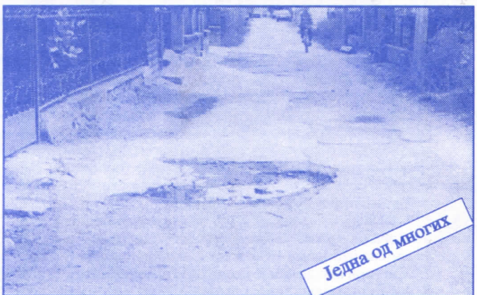
Једна од многих

Подржаваћемо донаторство и спонзорство као вид помагања културним установама. Покренућемо отварање нових огранака библиотеке и обезбедити простор за њих (евентуално просторије месних заједница). Обновићемо домове културе у свим приградским насељима.