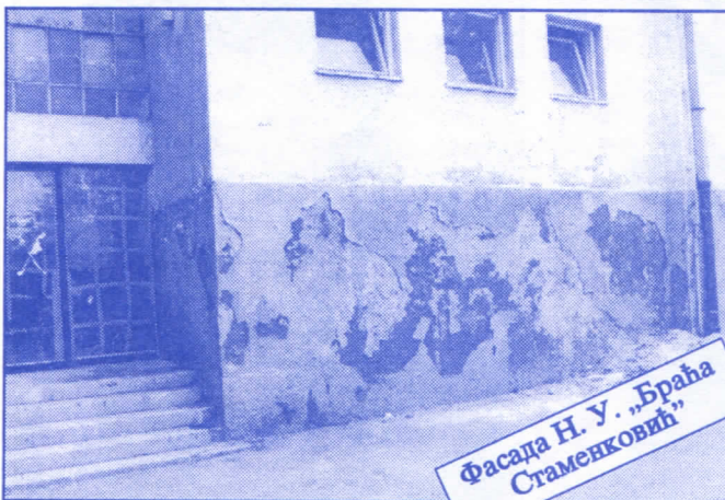
Фасада Н. У. „Браћа Стаменковић“

Преуговарање коришћења пословног простора са свим корисницима и јавно оглашавање издавања неискоришћеног пословног простора. Сви постојећи уговори штетни по Јавно предузеће, типа пазакупа и франшизе, биће одмах раскинути. Преговараћемо са значајним домаћим и страним фирмама око отварања њихових представништва на територији општине Палилула под најповољнијим условима. Смањићемо број корисника који користе простор без накнаде.