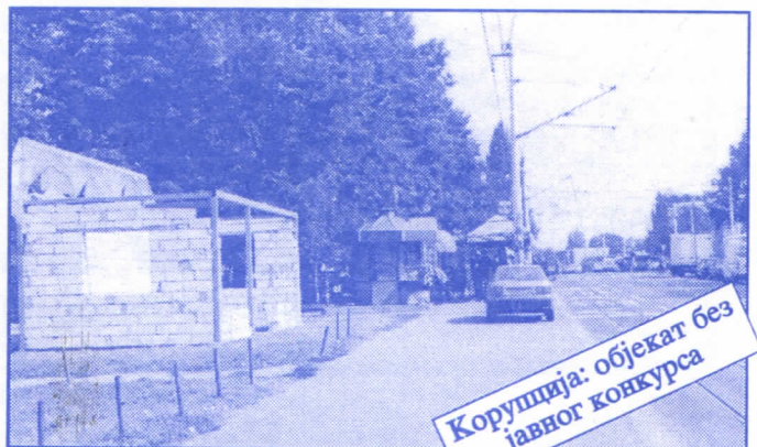
Корупција: објекат без јавног конкурса

Општина ће помоћи социјално најугроженије становнике Палилуле. Та помоћ ће имати једнократни карактер. Примат у оваквим акцијама имаће деца без родитеља, деца палих бораца, инвалиди последњег рата, стари грађани и физички хендикепирани лица. Организовање овакве помоћи биће обављено путем конкурса објављеног у општинским новинама (или другим средствима јавног информисања) на који ће моћи да се пријаве сви грађани општине Палилуле.