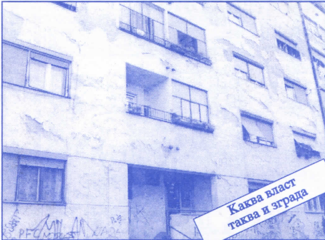
Каква власт таква и зграда

Заложите се за пројектовање и изградњу канализације за кишне и отпадне воде у сеоским насељима, очистићемо колекторе, умањимо опасност од бујица и активирања клизишта. У градском делу Палилуле решићемо проблем атмосферских вода које при изградњи новијих објеката нису каналисане те у време киша угрожавају сутерене и подруме околних зграда.