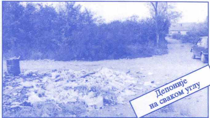
Депоније на сваком углу

• Оснивач и издавач: др Војислав Шешељ • Издање приредио: Општински одбор Српске радикалне странке Палилуле • Главни и одговорни уредник: Синиша Аксентијевић • Заменик главног и одговорног уредника: Душан Весић • Помоћник главног и одговорног уредника: Јасна Олујић Радовановић • Техничко уређење и компјутерски прелом: Бранка Божић и Саша Радовановић • Лектор: Зорица Илић • Редакција: Момир Марковић, Наташа Јовановић, Јадранка Шешељ, Јана Живаљевић, Александар Вучић, Драгољуб Стаменковић, Весна Арсић, Коста Димитријевић, Вељко Дукић, Весна Марић. • Секретар редакције: Љиљана Михајловић. • Штампа: „Стебра“ Војни пут блок 2/250ц, Земун