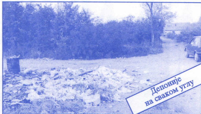
Депоније на сваком углу

• Оснивач и издавач: др Војислав Шешељ • Издање приредио: Општински одбор Српске радикалне странке Палилуле • Главни и одговорни уредник: Синиша Аксентијевић • Заменик главног и одговорног уредника: Душан Весић • Помоћник главног и одговорног уредника: Јасна Олујић Радовановић • Техничко уређење и компјутерски прелом: Бранка Божић и Саша Радовановић • Лектор: Зорица Илић • Редакција: Момир Марковић, Наташа Јовановић, Јадранка Шешељ, Јана Живаљевић, Александар Вучић, Драгољуб Стаменковић, Весна Арсић, Коста Димитријевић, Вељко Дукић, Весна Марић. • Секретар редакције: Љиљана Михајловић. • Штампа: „Стебра“ Војни пут блок 2/250ц, Земун