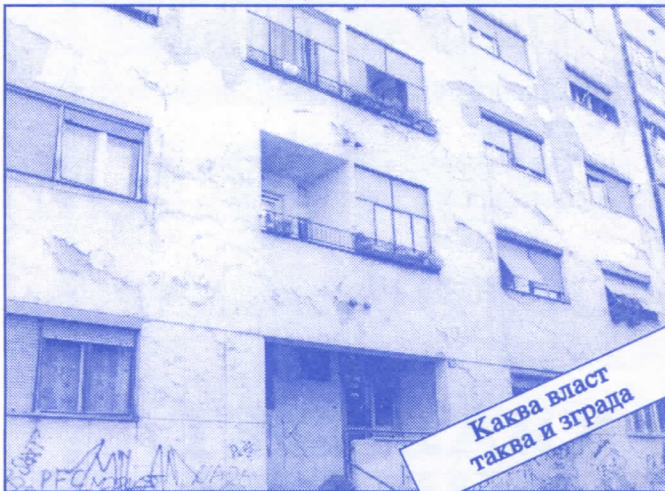
Каква власт таква и зграда

Заложите се за пројектовање и изградњу канализације за кишне и отпадне воде у сеоским насељима, очистићемо колекторе, умањимо опасност од бујица и активирања клизишта. У градском делу Палилуле решићемо проблем атмосферских вода које при изградњи новијих објеката нису каналисане те у време киша угрожавају сутерене и подруме околних зграда.