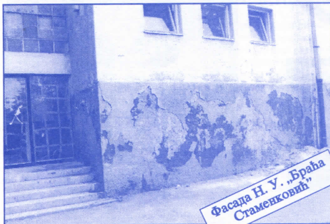
Фасада Н. У. „Браћа Стаменковић“

Преуговарање коришћења пословног простора са свим корисницима и јавно оглашавање издавања неискоришћеног пословног простора. Сви постојећи уговори штетни по Јавно предузеће, типа пазакупа и франшизе, биће одмах раскинути. Преговараћемо са значајним домаћим и страним фирмама око отварања њихових представништва на територији општине Палилула под најповољнијим условима. Смањићемо број корисника који користе простор без накнаде.