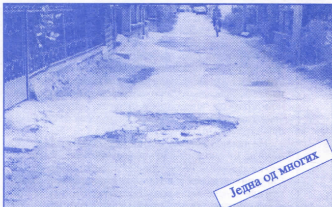
Једна од многих

Подржаваћемо донаторство и спонзорство као вид помагања културним установама. Покренућемо отварање нових огранака библиотеке и обезбедити простор за њих (евентуално просторије месних заједница). Обновићемо домове културе у свим приградским насељима.