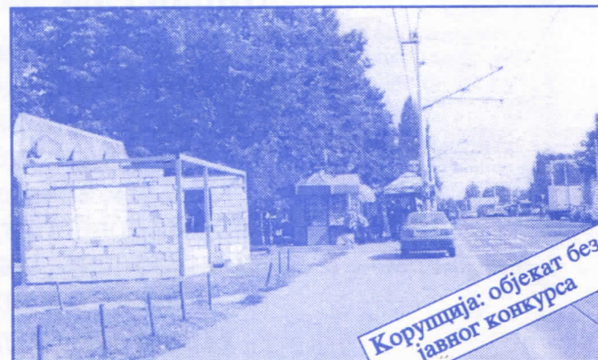
Корупција: објекат без јавног конкурса

Општина ће помоћи социјално најугроженије становнике Палилуле. Та помоћ ће имати једнократни карактер. Примат у оваквим акцијама имаће деца без родитеља, деца палих бораца, инвалиди последњег рата, стари грађани и физички хендикепирана лица. Организовање овакве помоћи биће обавњено путем конкурса објављеног у општинским новинама (или другим средствима јавног информисања) на који ће моћи да се пријаве сви грађани општине Палилуле.