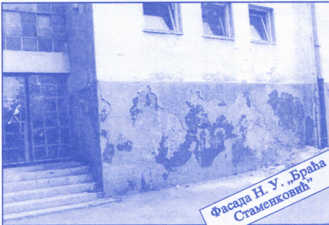
Фасада Н. У. „Браћа Стаменковић“

Грађевинско земљиште које је у општинској својини, понудићемо на лицитацију и под једнаким условима омогућићемо учешће физичким и правним лицима.