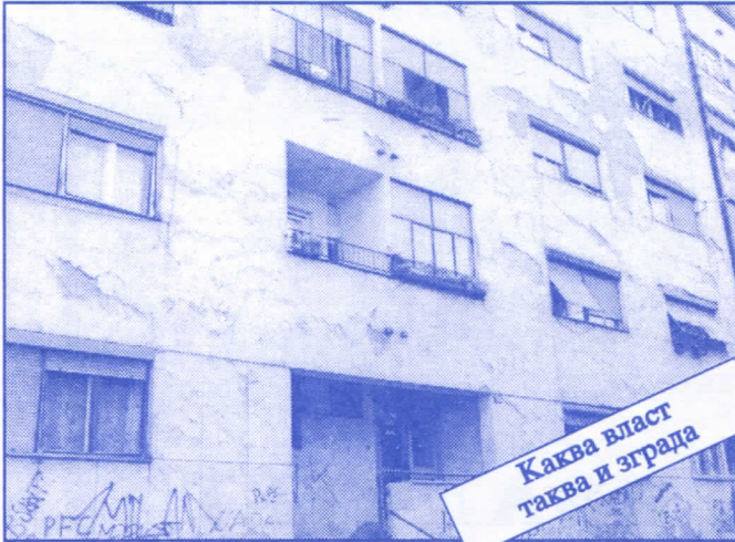
Каква власт таква и зграда

Заложићемо се за пројектовање и изградњу канализације за кишне и отпадне воде у сеоским насељима, очистићемо колекторе, умањићемо опасност од бујица и активирања клизишта. У градском делу Палилуле решићемо проблем атмосферских вода које при изградњи новијих објеката нису каналисане те у време киша угрожавају сутерене и подруме околних зграда.