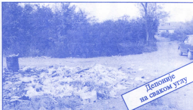
Депоније на сваком углу

Општинском одбору Српске радикалне странке Палилула; Улица Прерадовићева 4, 11000 Београд; телефон: 764-546 и 766-889.