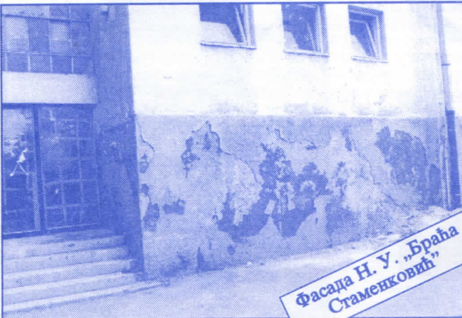
Фасада Н. У. „Браћа Стаменковић“

Грађевинско земљиште које је у општинској својини, понудићемо на лицитацију и под једнаким условима омогућићемо учешће физичким и правним лицима.