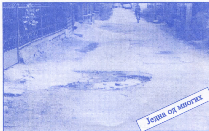
Једна од многих

Подржаваћемо донаторство и спонзорство као вид помагања културним установама. Покренућемо отварање нових огранака библиотеке и обезбедити простор за њих (евентуално просторије месних заједница). Обновићемо домове културе у свим приградским насељима.