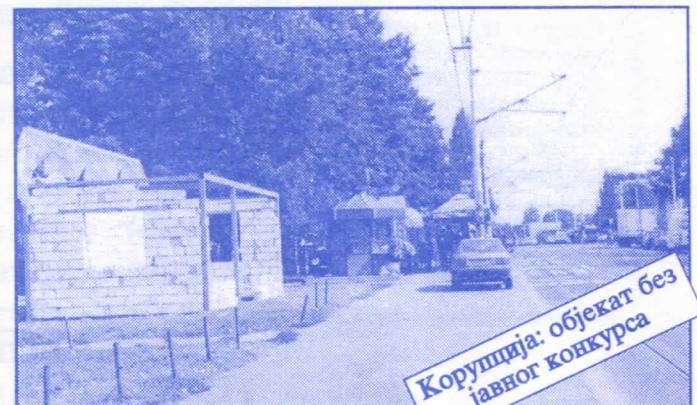
Корупција: објекат без јавног конкурса

Општина ће помоћи социјално најугроженије становнике Палилуле. Та помоћ ће имати једнократни карактер. Примат у оваквим акцијама имаће деца без родитеља, деца палих бораца, инвалиди последњег рата, стари грађани и физички хендикепирана лица. Организоваће овакве помоћи биће обављено путем конкурса објављеног у општинским новинама (или другим средствима јавног информисања) на који ће моћи да се пријаве сви грађани општине Палилуле.