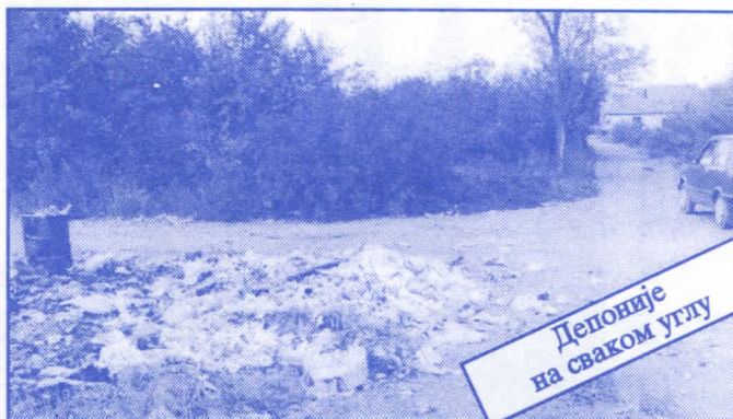
Депоније на сваком углу

Заложићемо се за пројектовање и изградњу канализације за кишне и отпадне воде у сеоским насељима, очистићемо колекторе, умањимо опасност од бујица и активирања клизишта. У градском делу Палилуле решићемо проблем атмосферских вода које при изградњи нових објеката нису каналисане те у време киша угрожавају сутерене и подруме околних зграда.