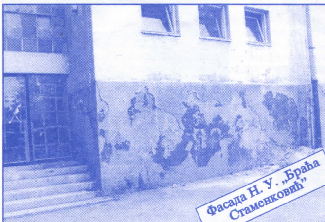
Фасада Н. У. „Браћа Стаменковић“

Грађевинско земљиште које је у општинској својини, понудићемо на лицитацију и под једнаким условима омогућићемо учешће физичким и правним лицима.