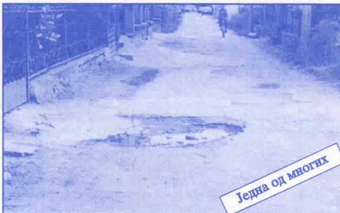
Једна од многих

Потрудићемо се да сваке године нађе нешто новца за помоћ спортским клубовима лоцираним на нашој општини. Најуспешнијим младим спортистима, Општина ће сваке године уручивати новчану награду. Помагаћемо општинска такмичења у којима ће учествовати пре свега школска омладина.