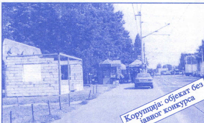
Корупција: објекат без јавног конкурса

Општина ће помоћи социјално најугроженије становнике Палилуле. Та помоћ ће имати једнократни карактер. Примат у оваквим акцијама имаће деца без родитеља, деца палих бораца, инвалиди последњег рата, стари грађани и физички хендикепирана лица. Организовање овакве помоћи биће обављено путем конкурса објављеног у општинским новинама (или другим средствима јавног информисања) на који ће моћи да се пријаве сви грађани општине Палилуле.