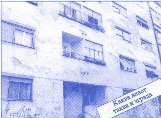
Каква власт таква и зграда

Подржаваћемо донаторство и спонзорство као вид помагања културним установама. Покренућемо отварање нових огранака библиотеке и обезбедити простор за њих (евентуално просторије месних заједница). Обновићемо доmove културе у свим приградским насељима.