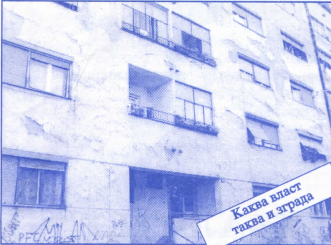
Каква власт таква и зграда

Заложите се за пројектовање и изградњу канализације за кишне и отпадне воде у сеоским насељима, очистићемо колекторе, умањимо опасност од бујица и активирања клизишта. У градском делу Палилуле решићемо проблем атмосферских вода које при изградњи новијих објеката нису канализане те у време киша угрожавају сутерене и подруме околних зграда.