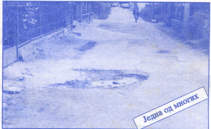
Једна од многих

Подржаваћемо донаторство и спонзорство као вид помагања културним установама. Покренућемо отварање нових огранака библиотеке и обезбедити простор за њих (евентуално просторије месних заједница). Обновићемо домове културе у свим приградским насељима.