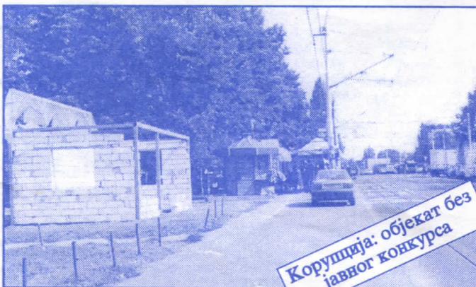
Корупција: објект без јавног конкурса

Општина ће помоћи социјално најугроженије становнике Палилуле. Та помоћ ће имати једнократни карактер. Примат у оваквим акцијама имаће деца без родитеља, деца палих бораца, инвалиди последњег рата, стари грађани и физички хендикепирана лица. Организовање овакве помоћи биће обавњено путем конкурса објављеног у општинским новинама (или другим средствима јавног информисања) на који ће моћи да се пријаве сви грађани општине Палилуле.