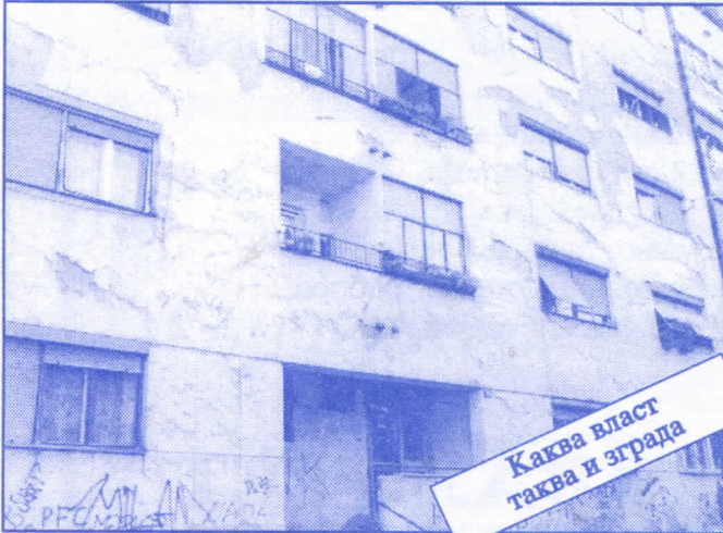
Каква власт таква и зграда

Заложите се за пројектовање и изградњу канализације за кишне и отпадне воде у сеоским насељима, очистићемо колекторе, умањимо опасност од бујица и активирања клизишта. У градском делу Палилуле решићемо проблем атмосферских вода које при изградњи новијих објеката нису канализане те у време киша угрожавају сутерене и подруме околних зграда.