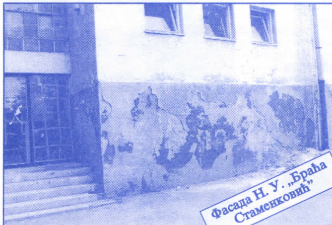
Фасада Н. У. „Браћа Стаменковић“

Грађевинско земљиште које је у општинској својини, понудићемо на лицитацију и под једнаким условима омогућићемо учешће физичким и правним лицима.