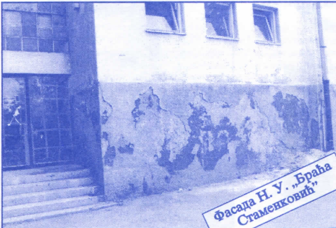
Фасада Н. У. „Браћа Стаменковић“

Грађевинско земљиште које је у општинској својини, понудићемо на лицитацију и под једнаким условима омогућићемо учешће физичким и правним лицима.