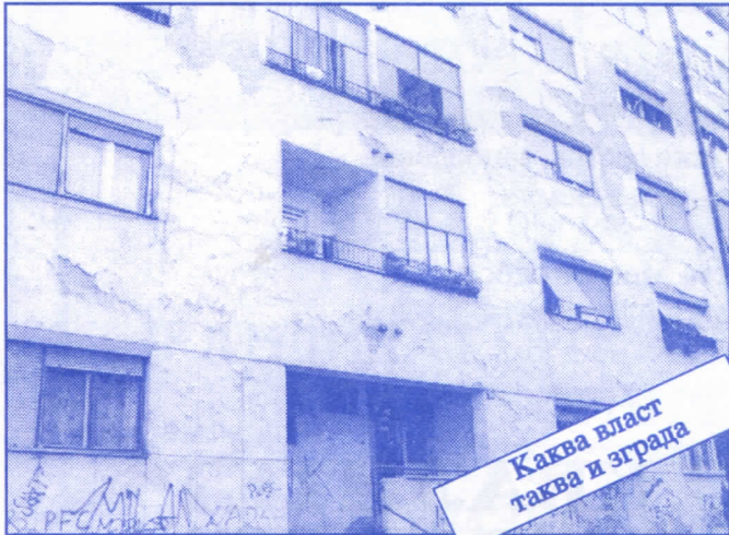
Каква власт таква и зграда

Заложите се за пројектовање и изградњу канализације за кишне и отпадне воде у сеоским насељима, очистићемо колекторе, умањимо опасност од бујица и активирања клизишта. У градском делу Палилуле решићемо проблем атмосферских вода које при изградњи новијих објеката нису каналисане те у време киша угрожавају сутерене и подруме околних зграда.