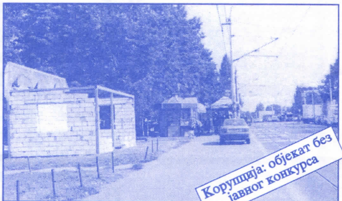
Корупција: објекат без јавног конкурса

Општина ће помоћи социјално најугроженије становнике Палилуле. Та помоћ ће имати једнократни карактер. Примат у оваквим акцијама имаће деца без родитеља, деца палих бораца, инвалиди последњег рата, стари грађани и физички хендикепирана лица. Организовање овакве помоћи биће обављено путем конкурса објављеног у општинским новинама (или другим средствима јавног информисања) на који ће моћи да се пријаве сви грађани општине Палилуле.