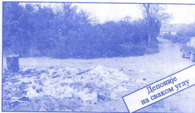
Депоније на сваком углу

Заложићемо се за пројектовање и изградњу канализације за кишне и отпадне воде у сеоским насељима, очистићемо колекторе, умањићемо опасност од бујица и активирања клизишта. У градском делу Палилуле решићемо проблем атмосферских вода које при изградњи новијих објеката нису каналисане те у време киша угрожавају сутерене и подруме околних зграда.