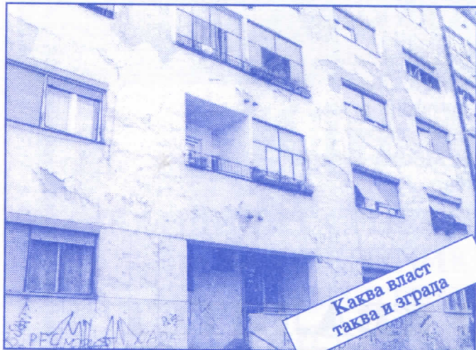
Каква власт таква и зграда

Према плану Општинског одбора Српске радикалне странке Палилуле, начињене су смернице асфалтирања и санирања коловоза, ударних рупа, израда и поправка тротоара, као и постављање саобраћајних знакова на територијама свих месних заједница.