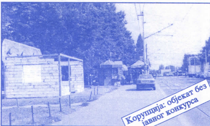
Корупција: објекат без јавног конкурса

Општина ће помоћи социјално најугроженије становнике Палилуле. Та помоћ ће имати једнократни карактер. Примат у оваквим акцијама имаће деца без родитеља, деца палих бораца, инвалиди последњег рата, стари грађани и физички хендикепирана лица. Организовање овакве помоћи биће обављено путем конкурса објављеног у општинским новинама (или другим средствима јавног информисања) на који ће моћи да се пријаве сви грађани општине Палилуле.