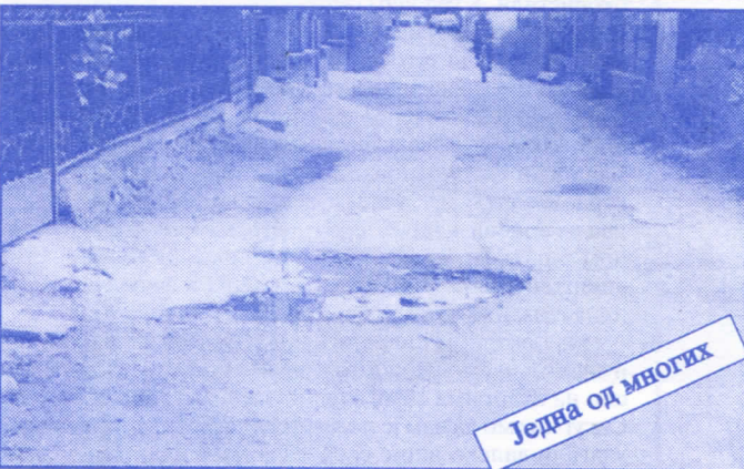
Једна од многих

Подржаваћемо донаторство и спонзорство као вид помагања културним установама. Покренућемо отварање нових огранака библиотеке и обезбедити простор за њих (евентуално просторије месних заједница). Обновићемо домове културе у свим приградским насељима.