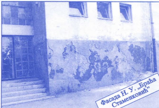
Фасада Н. У. „Браћа Стамениковић“

Грађевинско земљиште које је у општинској својини, понудићемо на лицитацију и под једнаким условима омогућићемо учешће физичким и правним лицима.