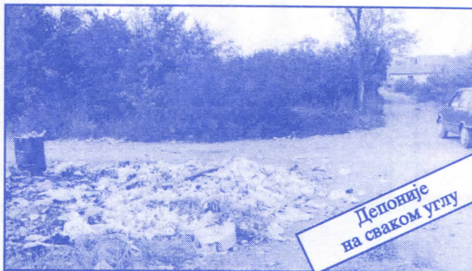
Депоније на сваком углу

Заложићемо се за пројектовање и изградњу канализације за кишне и отпадне воде у сеоским насељима, очистићемо колекторе, умањимо опасност од бујица и активирања клизишта. У градском делу Палилуле решићемо проблем атмосферских вода које при изградњи новијих објеката нису каналисане те у време киша угрожавају сутерене и подруме околних зграда.