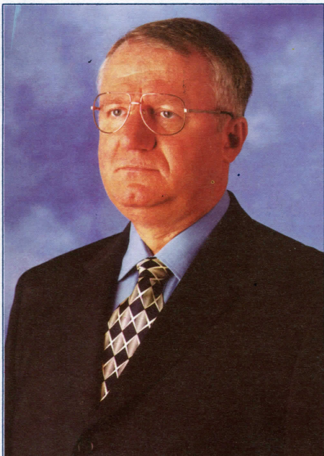
Председник Српске радикалне странке Др Војислав Шешељ