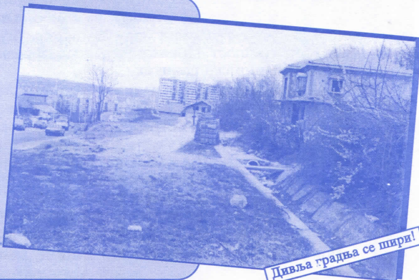
Дивља градња се шири!

17. МЗ „СТАРО МИРИЈЕВО“ Уредићемо водовод и канализацију Асфалтираћемо улице и поставићемо ковтејнере Завршићемо увођење нових телефонских прикључака