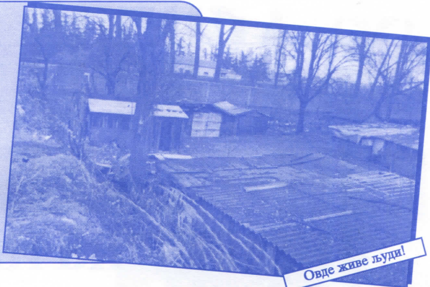
Овде живе људи!

11. МЗ „СТЕВАН СИНЂЕЛИЋ“ Урадићемо окретницу за градски саобраћај Уредићемо пословни простор око Месне заједнице