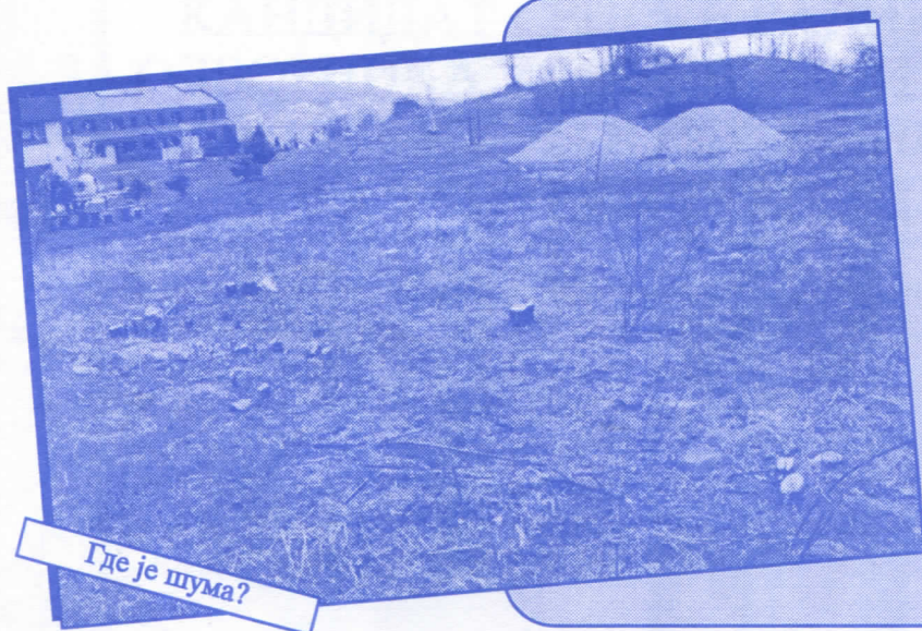
Где је шума?

12. МЗ „МАЛИ МОКРИ ЛУГ“ Проширићемо и реновирати просторије Месне заједнице и амбуланту Уредићемо прилазе гробљу