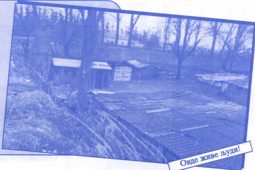
Овде живе људи!

Урадићемо окретницу за градски саобраћај Уредићемо пословни простор око Месне заједнице