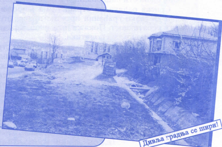
Дивља градња се шири!

Уредићемо водовод и канализацију Асфалтираћемо улице и поставићемо контејнере Завршићемо увођење нових телефонских прикључака