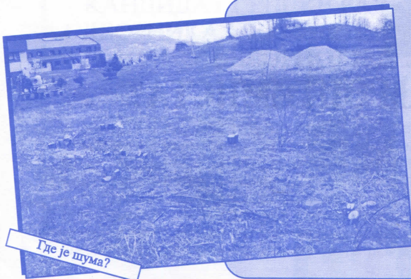
Где је шума?