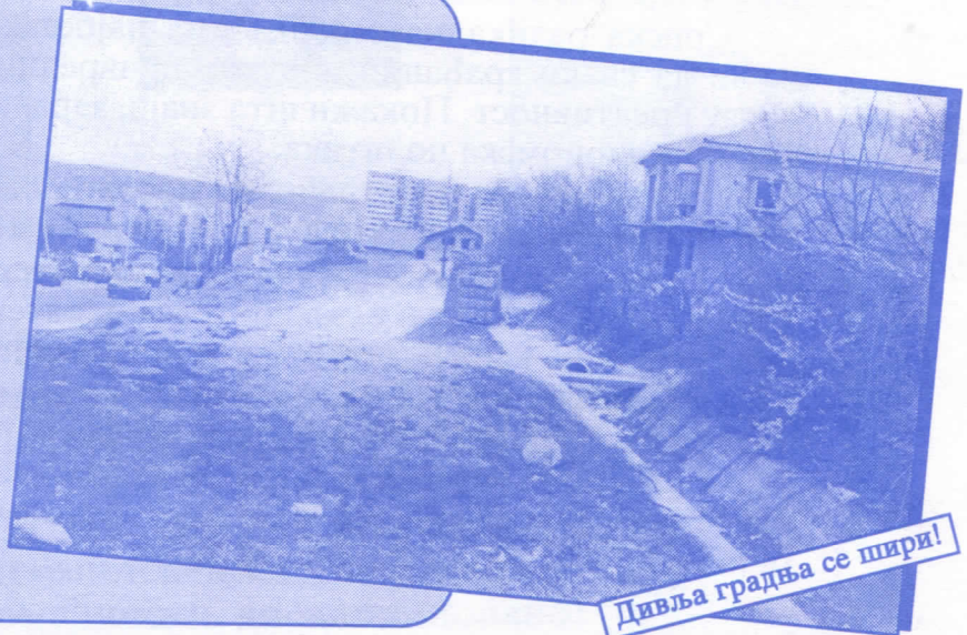
Дивља градња се шири!

• Оснивач и издавач: др Војислав Шешељ • Издање приредио: Општински одбор Српске радикалне странке Нови Београд • Главни и одговорни уредник: Синиша Аксентијевић • Заменик главног и одговорног уредника: Душан Весић • Помоћник главног и одговорног уредника: Јасна Олујић Радовановић • Техничко уређење и компјутерски прелом: Бранка Бобић и Саша Радовановић • Лектор: Зорица Илић • Редакција: Момир Марковић, Наташа Јовановић, Јадранка Шешељ, Јана Живаљевић, Александар Вучић, Драгољуб Стаменковић, Весна Арсић, Коста Димитријевић, Вељко Дукић, Весна Марић. • Секретар редакције: Љиљана Михајловић. • Штампла: „Стебра“ Војни пут блок 2/250ц, Земун