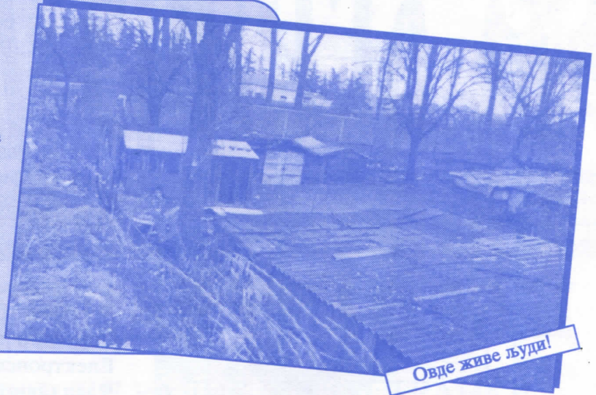
Овде живе људи!

Урадићемо окретницу за градски саобраћај Уредићемо пословни простор око Месне заједнице