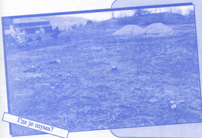
Где је шума?