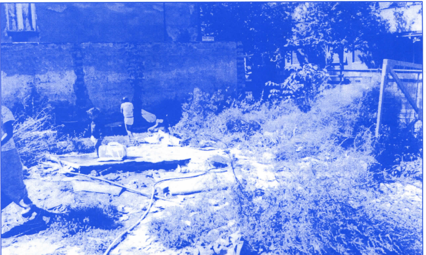
Досадашња власт на Врачару је показала да је најлакше рушити

Председник општине и сви одборници мораће да буду у сталном контакту са грађанима и да непрестано изналазе начине да им, колико је то у њиховој моћи, помогну, а не да после избора изгубе сваки контакт са њима и