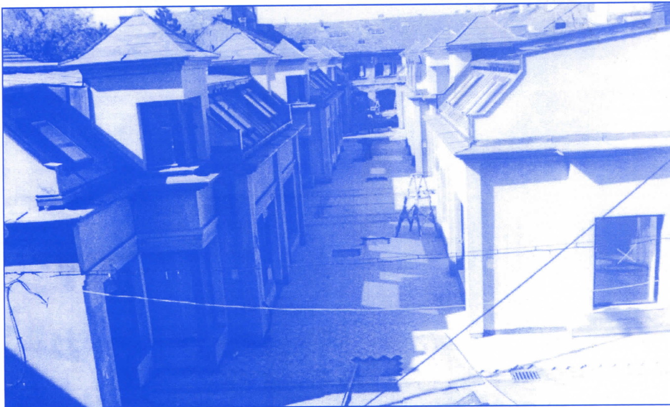
Радикалска власт у Земуну је доказала да способни граде

Без обзира на то што је санирање постојећих и изградња нових улица у надлежности Скупштине града, српски радикали на Врачару, поучени бројним примерима из општине Земун, сигурно ће наћи потребна финансијска средства да поправе све улице и тротоаре на територији општине. Чистији ваздух и већа безбедност грађана омогућиће се краћим задржавањем возила која кроз подручје општине пролазе за насеља Шумице, Браће Јер-