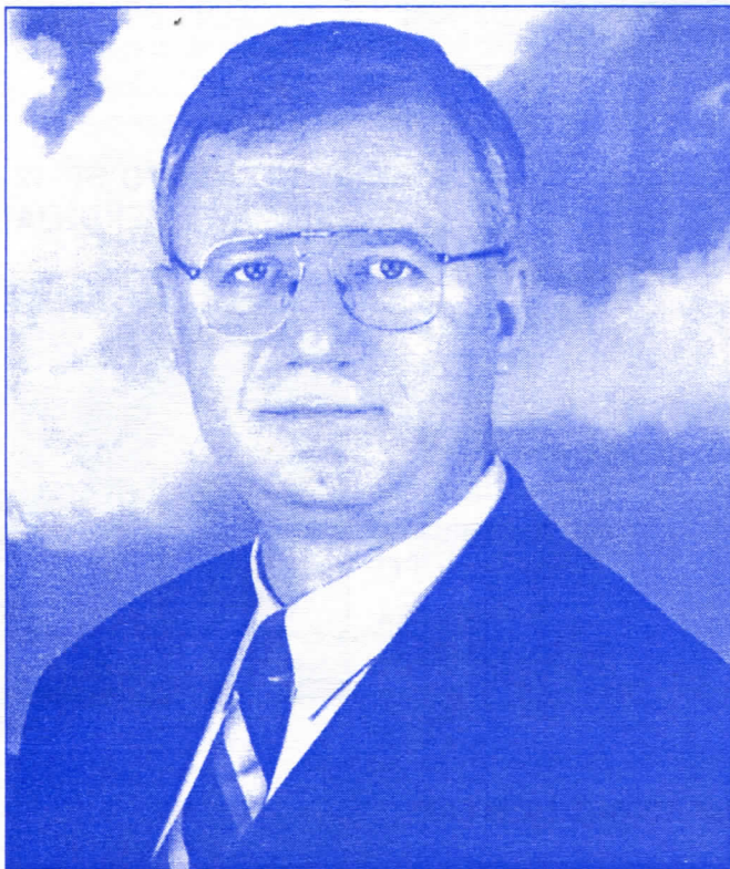
Председник Српске радикалне странке Др Војислав Шешел