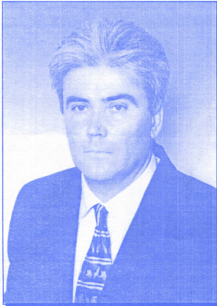
НАРОДНИ ПОСЛАНИК ВИТОМИР ПЛУЖАРЕВИЋ КАНДИДАТ ЗА ПОСЛАНИКА У СКУПШТИНИ АП ВОЈВОДИНЕ

РОЂЕН 03. ЈУНА 1950. ГОДИНЕ ПОТПРЕДСЕДНИК ИЗВРШНОГ ОДБОРА СРПСКЕ РАДИКАЛНЕ СТРАНКЕ СРБИЈЕ ПРЕДСЕДНИК ОКРУЖНОГ ОДБОРА СРПСКЕ РАДИКАЛНЕ СТРАНКЕ СРЕМСКОГ ОКРУГА