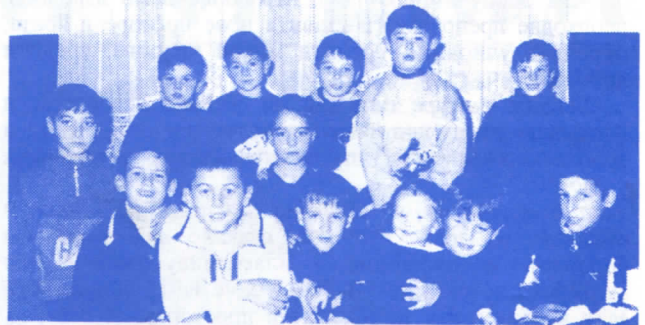
ЊИХ НИКАДА НЕЋЕМО ИЗНЕВЕРИТИ

Брига о деци свакако треба да има најважније место у животу сваког од нас. Та брига треба да буде највише испољена у самој породици, али не мање ни у предшколским и школским установама, поготову што данас родитељи због све тежег финансијског стања породице, имају све мање времена које посвећују својој деци. Ради што квалитетнијег васпитавања и образовања деце, по мишљењу СРС, деци треба омогућити да се уз игру оспособљавају за све животне изазове уз обезбеђење што квалитетнијих услова поготову у предшколским установама.