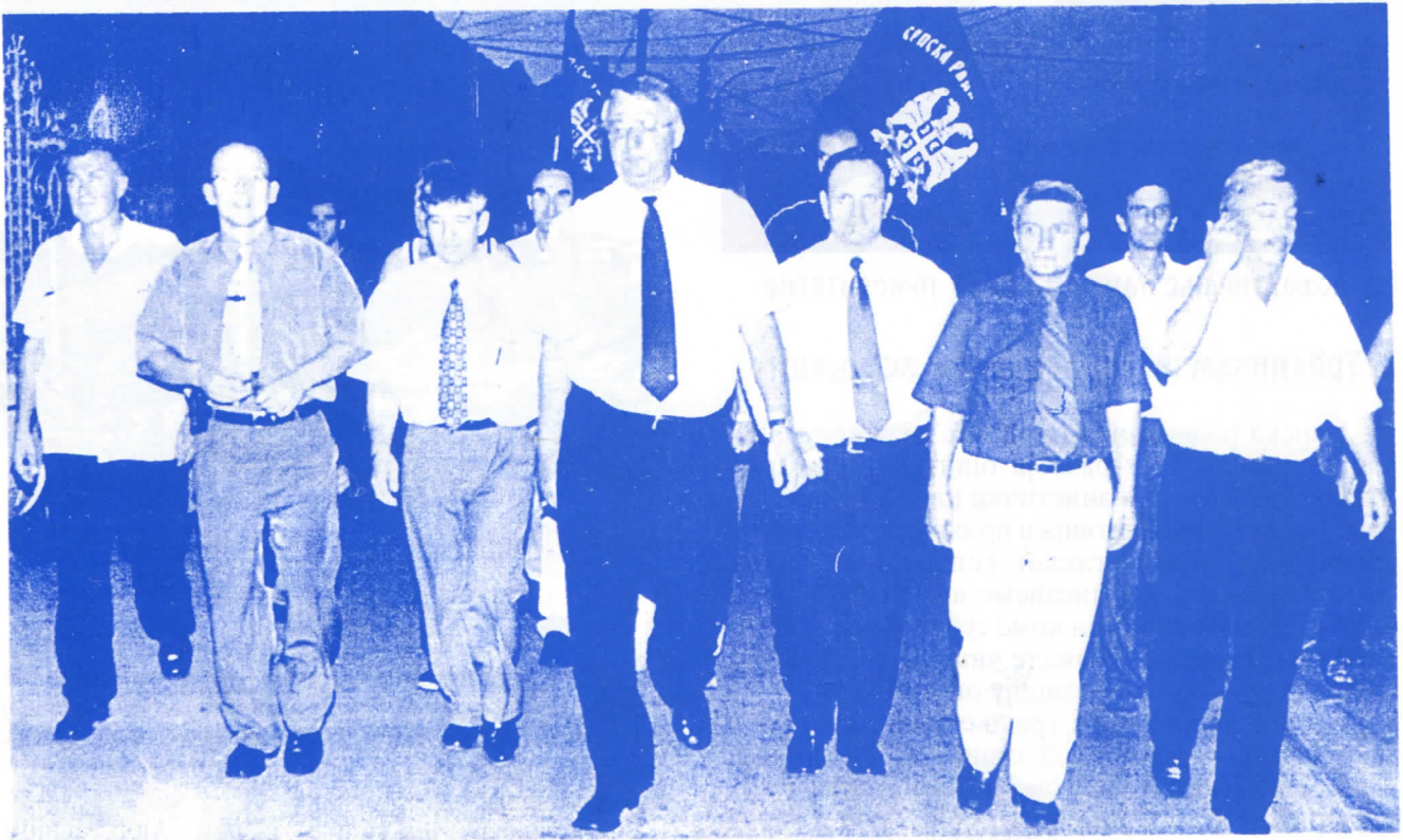
МИ ДОЛАЗИМО – СРПСКА РАДИКАЛНА СТРАНКА