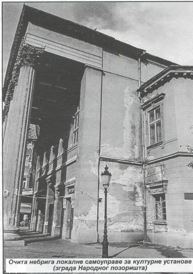
Очита небрига локалне самоуправе за културне установе (зграда Народног позоришта)

Реконструкцијом и развојем регионалног каналског система уз сарадњу са граничним општинама створићемо услове за одводњавање и коришћење транзитних вода (из акумулације) у свим индустријским зонама што ће довести до бржег развоја воћарства и производње здраве хране.