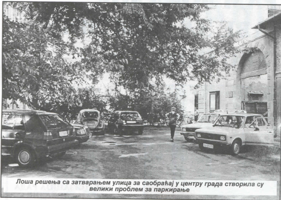
Лоша решења са затварањем улица за саобраћај у центру града створила су велики проблем за паркирање

Поштујући Устав државе, Законе и Статут општине Српска радикална странка ће реорганизовати рад општинских служби подређујући је основним принципу Српске радикалне странке - сав рад подредити интересу грађана и њиховом успешном задовољавању потреба.