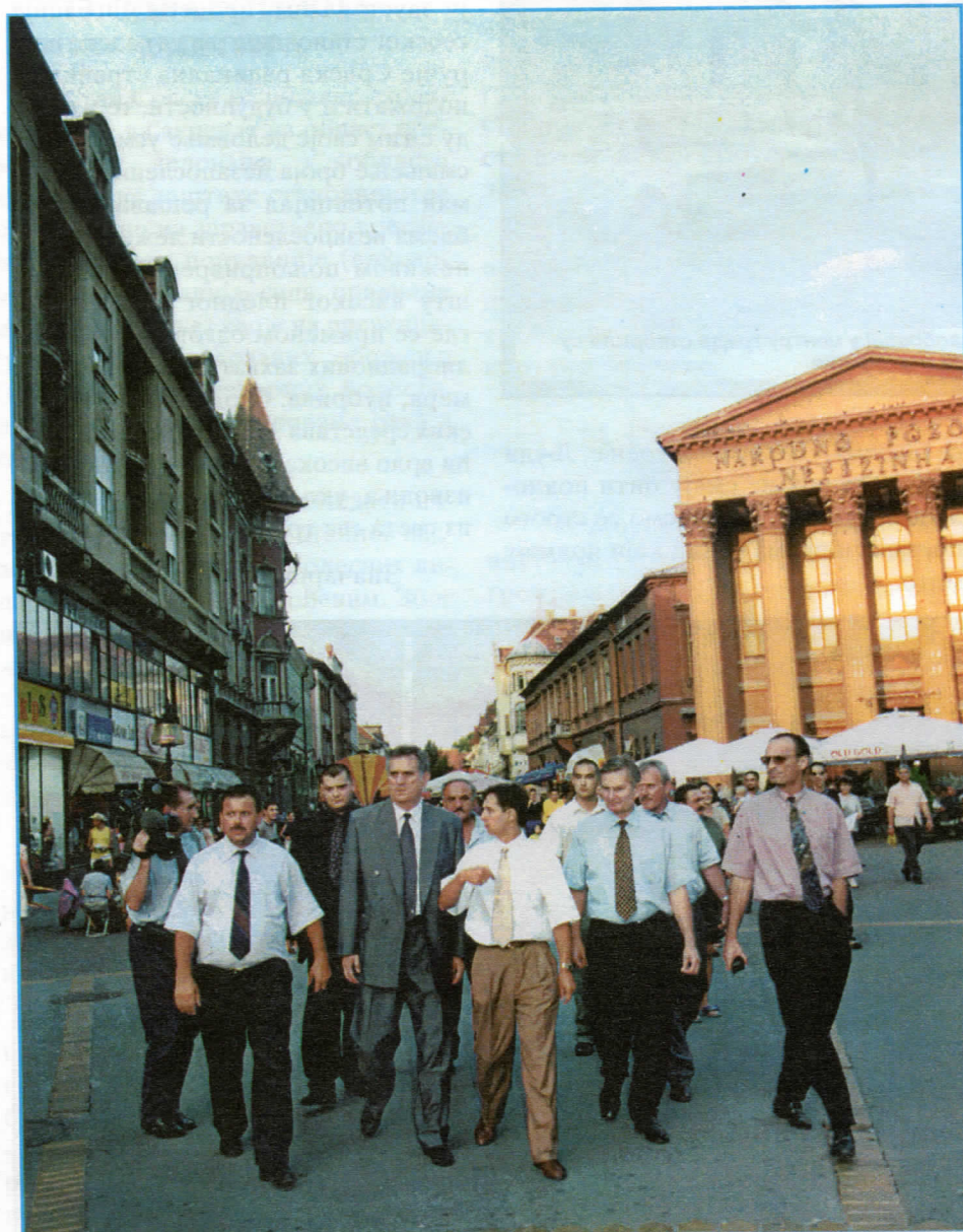
ПАМЕТ, ЗНАЊЕ И ПОШТЕЊЕ Српски радикали увек чиста образа пред народ. Председнички кандидат Српске радикалне странке за председника СРЈ г. Томислав Николић у обиласку Суботице