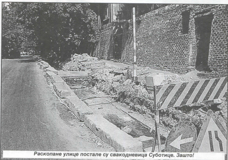
Раскопане улице постале су свакодневица Суботице. Зашто!