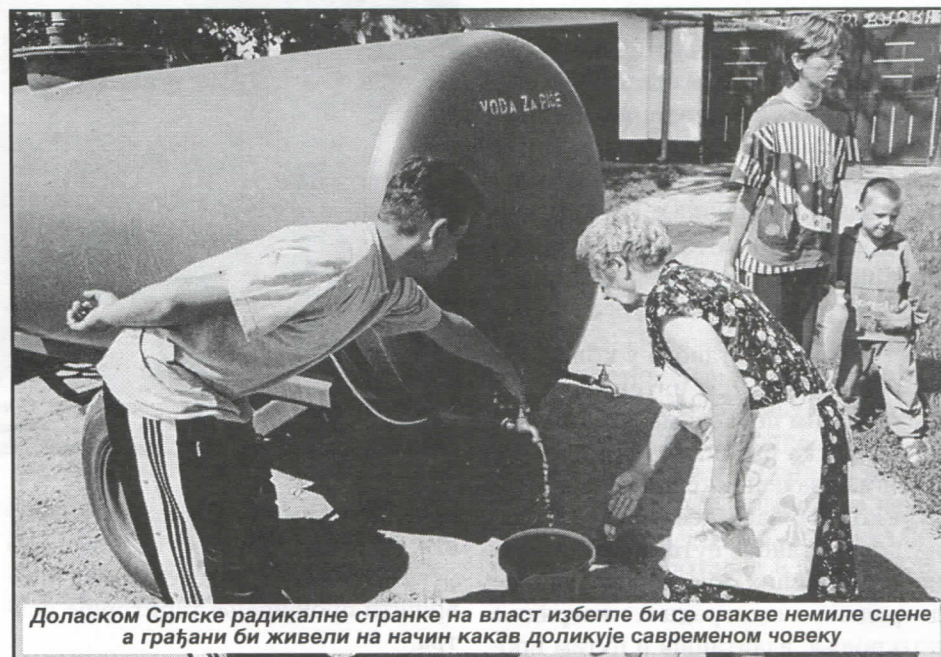
Доласком Српске радикалне странке на власт избегле би се овакве немиле сцене а грађани би живели на начин какав доликује савременом човеку

ћемо у што краћем року изменити све застареле планове и уз јавни увид предложена урбанистичка решења прилагодити интересима и потребама грађана и будућим инвеститорима. Ажурност органа општине у овом погледу ће бити на далеко ве-