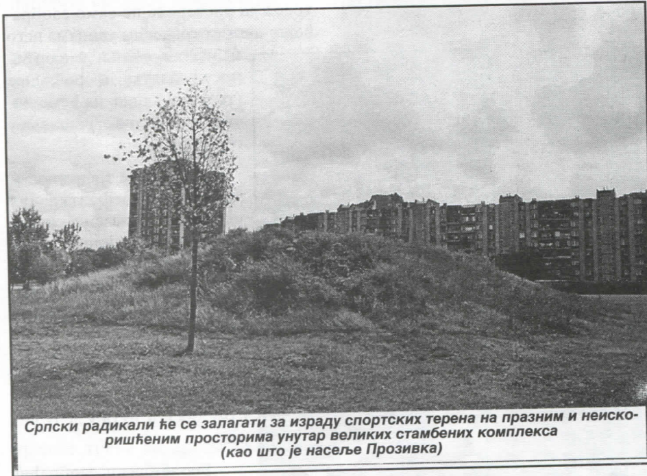
Српски радикали ће се залагати за израду спортских терена на празним и неискоришћеним просторима унутар великих стамбених комплекса (као што је насеље Прозивка)

ни стално заштравају, нарочито у зимском периоду.