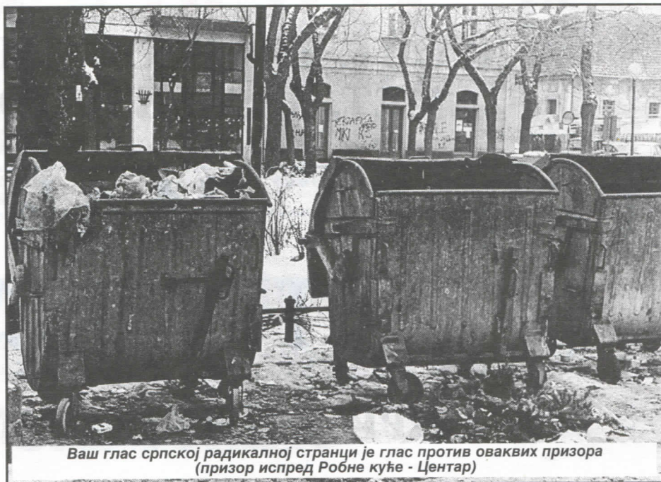
Ваш глас српској радикалној странци је глас против оваквих призора (призор испред Робне куће - Центар)

них капацитета хитне медицинске помоћи и дати јој приоритет над изградњом објеката примарне здравствене заштите. Залагаћемо се за отварање нових амбуланти у насељима.