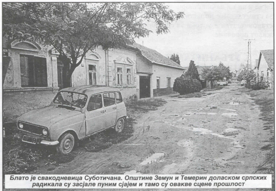
Блато је свакодневица Суботичана. Општине Земун и Темерин доласком српских радикала су засјале пуним сјајем и тамо су овакве сцене прошлост

Сузбијање бесправне стамбене изградње биће важно питање којим ћемо се забавити. Залагаћемо се за