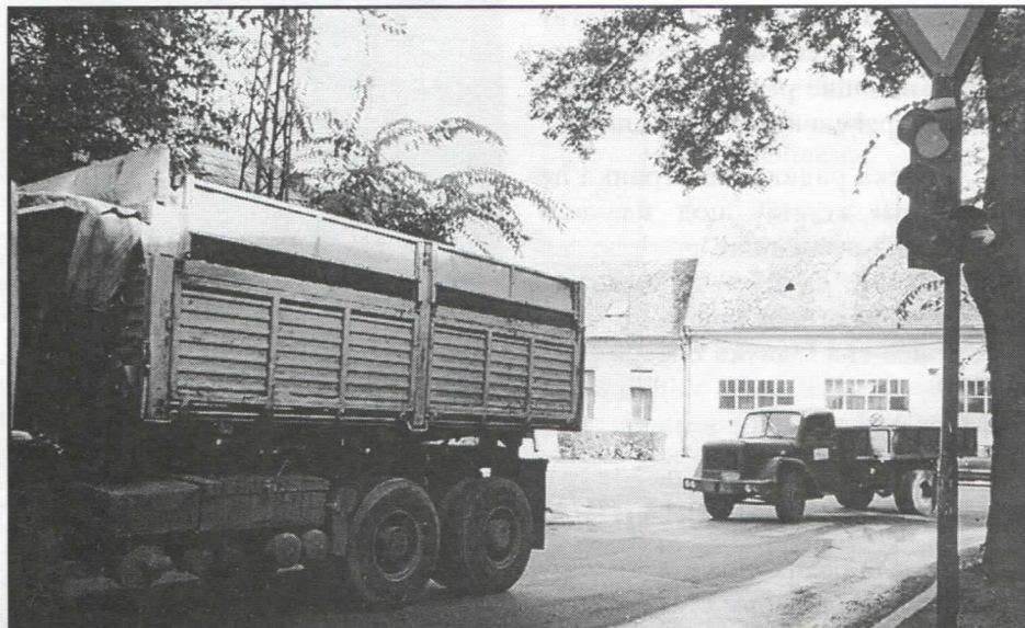
Лоше регулисан саобраћај у Суботици угрожава становништво и његову имовину (слегање кућа услед проласка тешких камиона, поред пута на раскрсници код ватрогасцаш)

Локације за изградњу и реконструкцију објеката, као и извођење других радова којима се изазивају промене у простору, утврђују се на основу одговарајуће урбанистичко-техничке документације засноване на законским начелима и као такви, став је Српске радикалне странке, морају се стриктно поштовати. Зато