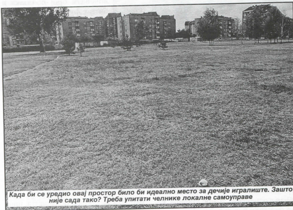
Када би се уредио овај простор било би идеално место за дечије игралиште. Зашто није сада тако? Треба упитати челнике локалне самоуправе

штити ваздуха, воде и земљишта (нарочито пољопривредног и за водоснабдевање). У том циљу тражићемо