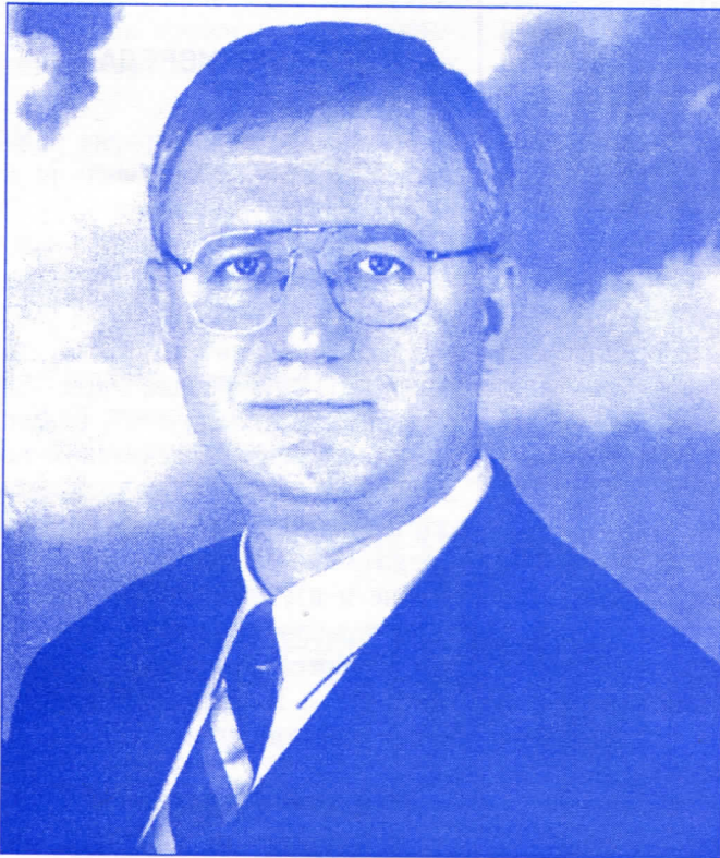
Председник Српске радикалне странке Др Војислав Шешелъ