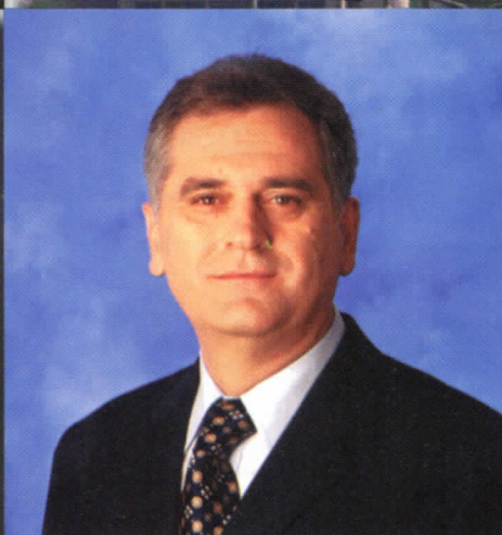
ТОМИСЛАВ НИКОЛИЋ КАНДИДАТ ЗА ПРЕДСЕДНИКА СР ЈУГОСЛАВИЈЕ