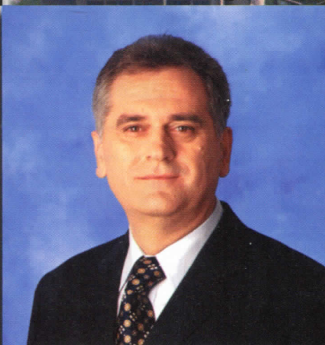
ТОМИСЛАВ НИКОЛИЋ КАНДИДАТ ЗА ПРЕДСЕДНИКА СР ЈУГОСЛАВИЈЕ