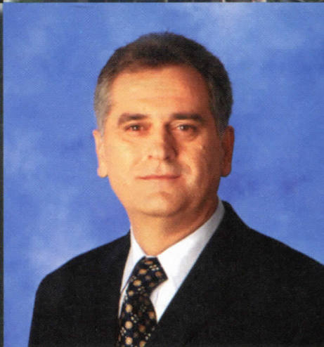
ТОМИСЛАВ НИКОЛИЋ КАНДИДАТ ЗА ПРЕДСЕДНИКА СР ЈУГОСЛАВИЈЕ