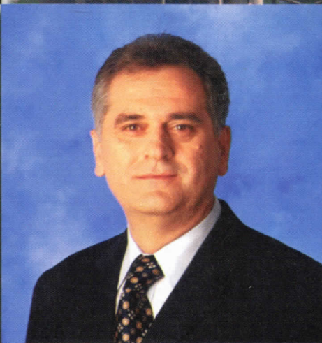
ТОМИСЛАВ НИКОЛИЋ КАНДИДАТ ЗА ПРЕДСЕДНИКА СР ЈУГОСЛАВИЈЕ