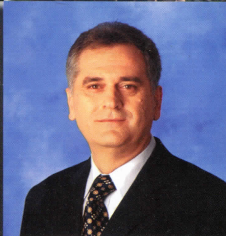
ТОМИСЛАВ НИКОЛИЋ КАНДИДАТ ЗА ПРЕДСЕДНИКА СР ЈУГОСЛАВИЈЕ