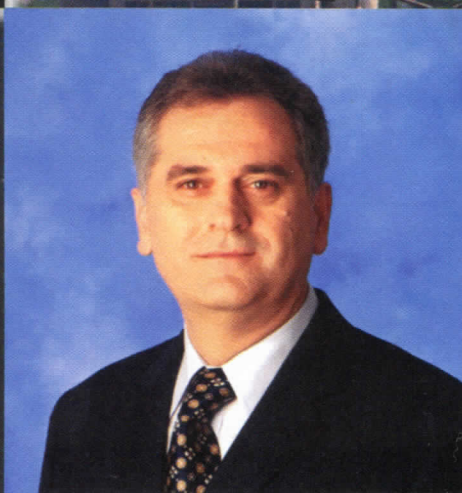
ТОМИСЛАВ НИКОЛИЋ КАНДИДАТ ЗА ПРЕДСЕДНИКА СР ЈУГОСЛАВИЈЕ