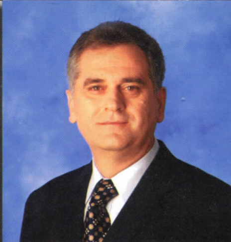
ТОМИСЛАВ НИКОЛИЋ КАНДИДАТ ЗА ПРЕДСЕДНИКА СР ЈУГОСЛАВИЈЕ