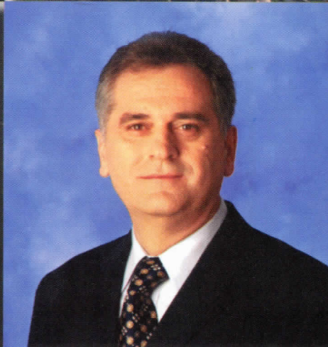
ТОМИСЛАВ НИКОЛИЋ КАНДИДАТ ЗА ПРЕДСЕДНИКА СР ЈУГОСЛАВИЈЕ