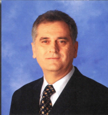
ТОМИСЛАВ НИКОЛИЋ КАНДИДАТ ЗА ПРЕДСЕДНИКА СР ЈУГОСЛАВИЈЕ