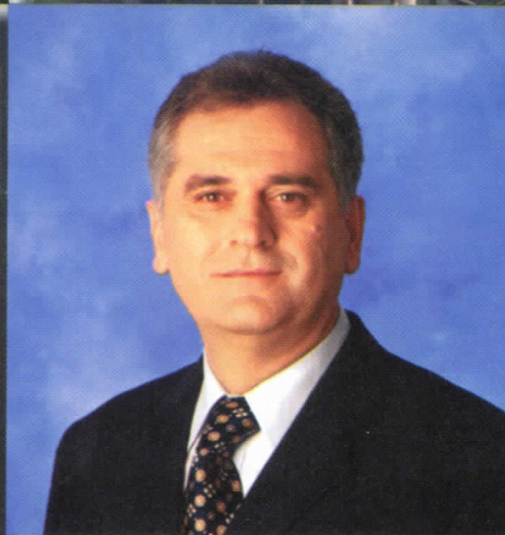
ТОМИСЛАВ НИКОЛИЋ КАНДИДАТ ЗА ПРЕДСЕДНИКА СР ЈУГОСЛАВИЈЕ