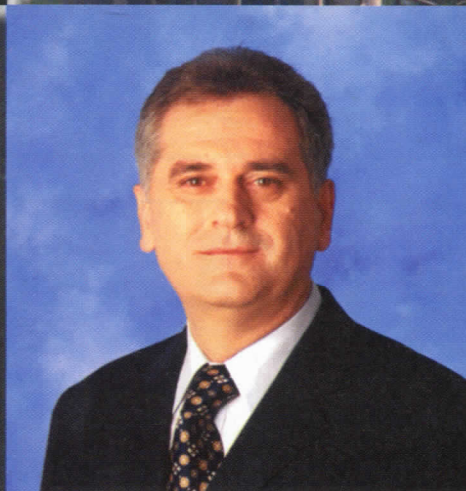
ТОМИСЛАВ НИКОЛИЋ КАНДИДАТ ЗА ПРЕДСЕДНИКА СР ЈУГОСЛАВИЈЕ