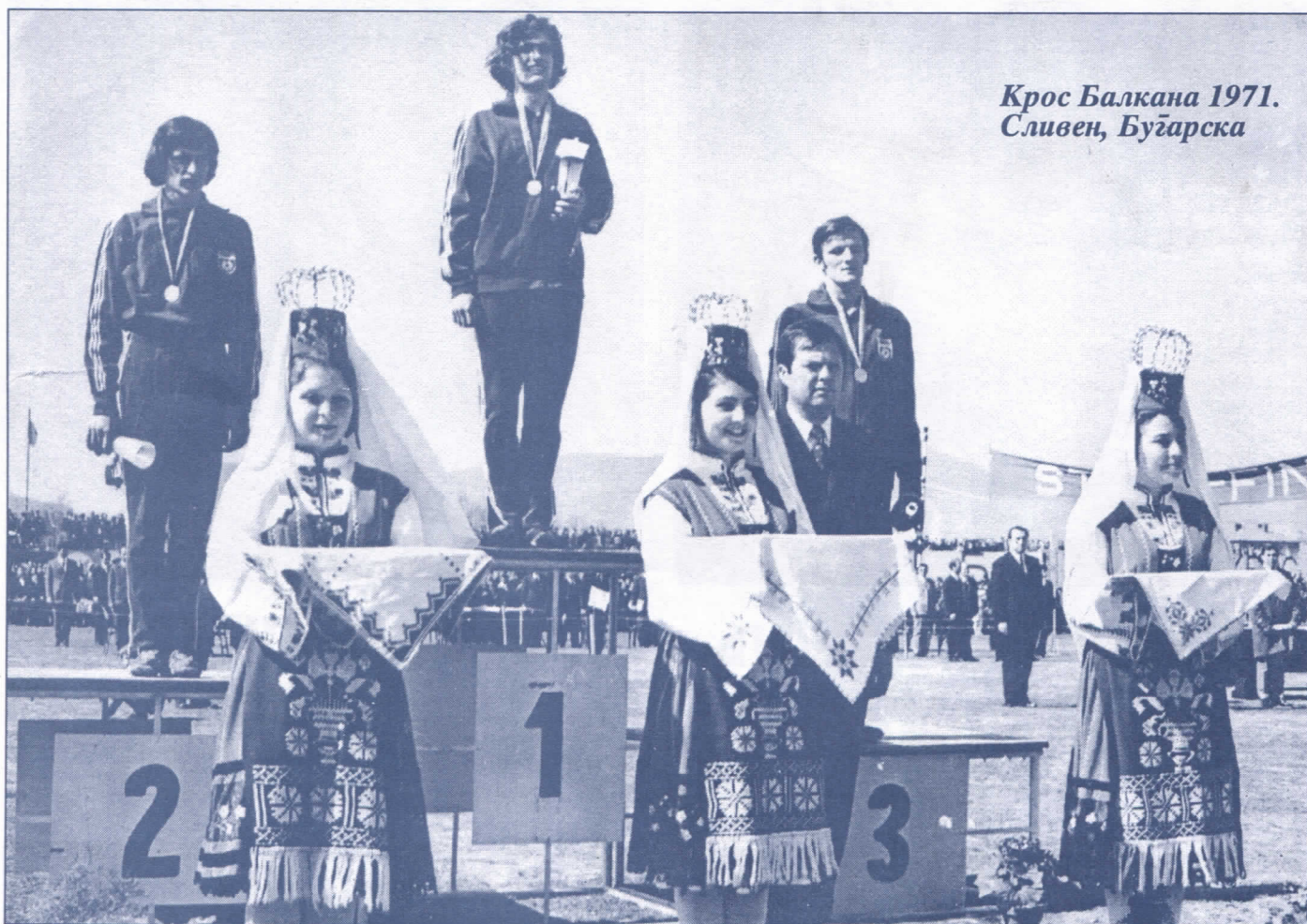
Крос Балкана 1971. Сливен, Бугарска

На функцији је подпредседника општинског одбора Српске радикалне странке.