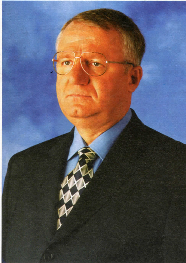
Председник Српске радикалне странке Др Војислав Шешељ