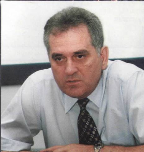
ТОМИСЛАВ НИКОЛИЋ КАНДИДАТ ЗА ПРЕДСЕДНИКА