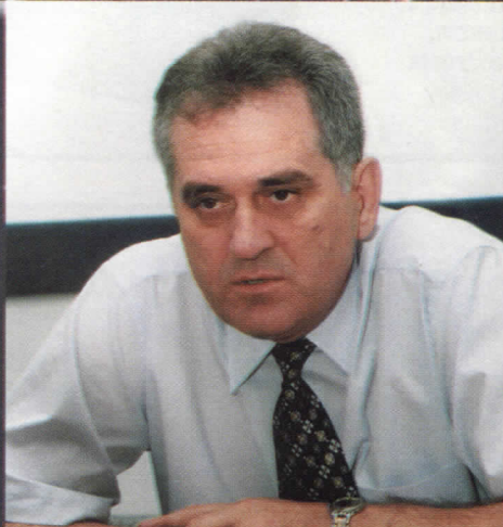
ТОМИСЛАВ НИКОЛИЋ КАНДИДАТ ЗА ПРЕДСЕДНИКА