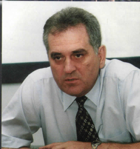
ТОМИСЛАВ НИКОЛИЋ КАНДИДАТ ЗА ПРЕДСЕДНИКА