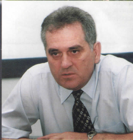
ТОМИСЛАВ НИКОЛИЋ КАНДИДАТ ЗА ПРЕДСЕДНИКА