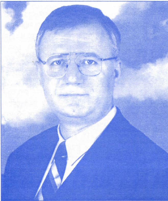
Председник Српске радикалне странке Др Војислав Шешел