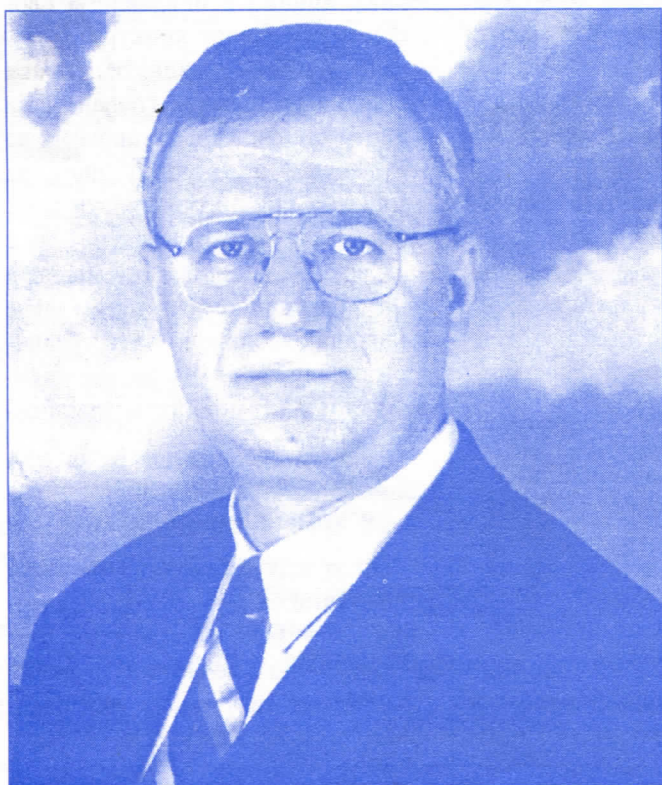
Председник Српске радикалне странке Др Војислав Шешелъ