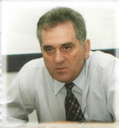
ТОМИСЛАВ НИКОЛИЋ КАНДИДАТ ЗА ПРЕДСЕДНИКА