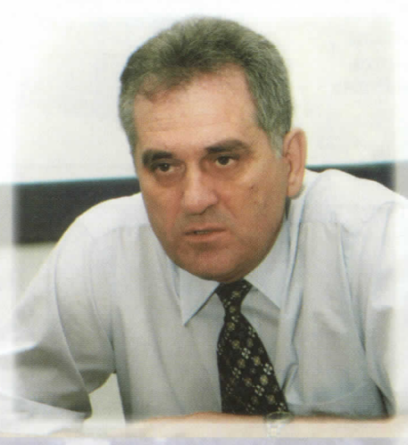
ТОМИСЛАВ НИКОЛИЋ КАНДИДАТ ЗА ПРЕДСЕДНИКА