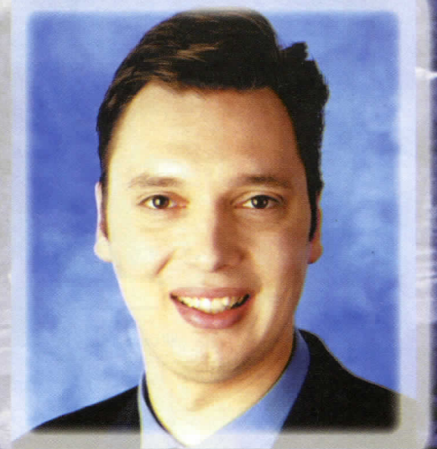
АЛЕКСАНДАР ВУЧИЋ КАНДИДАТ ЗА ГРАДСКОГ ОДБОРНИКА У ИЗБОРНОЈ ЈЕДИНИЦИ 67 Нови Београд 14