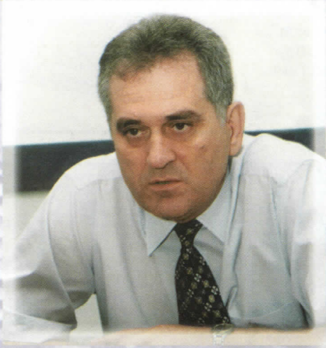
ТОМИСЛАВ НИКОЛИЋ КАНДИДАТ ЗА ПРЕДСЕДНИКА