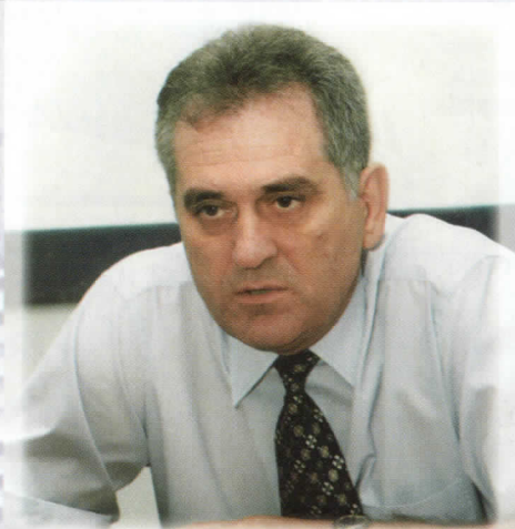
ТОМИСЛАВ НИКОЛИЋ КАНДИДАТ ЗА ПРЕДСЕДНИКА