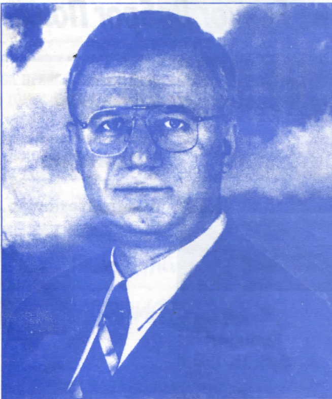
Председник Српске радикалне странке Др Војислав Шешел