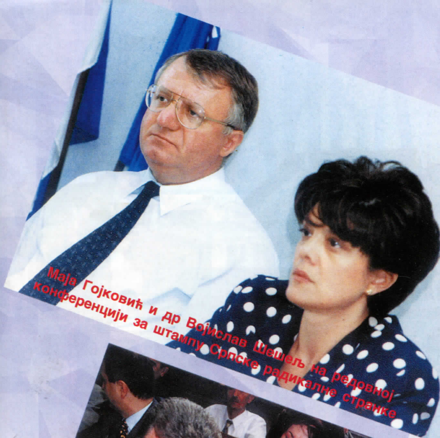
Mađa Gojković и др Војислав Шешел на редовној конференцији за штампу Српске радикалне странке