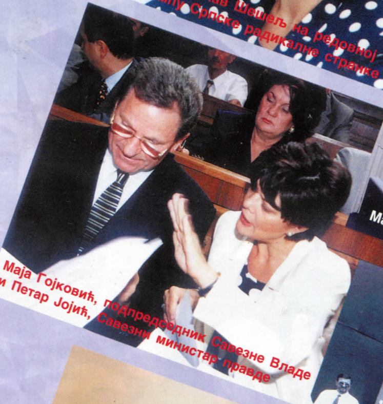
Mađa Gojković, подпредседник Савезне Владе и Петар Јојић, Савезни министар правде