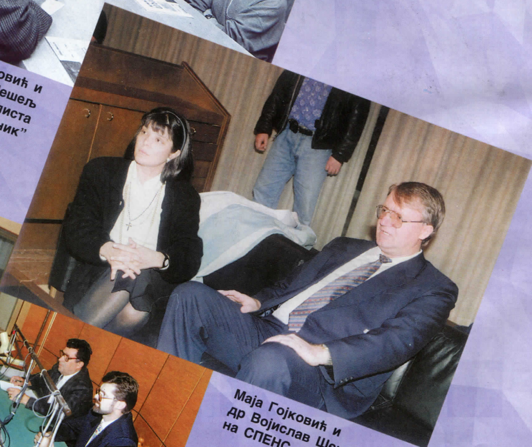
Маја Гојковић и др Војислав Шешел на СПЕНС-у