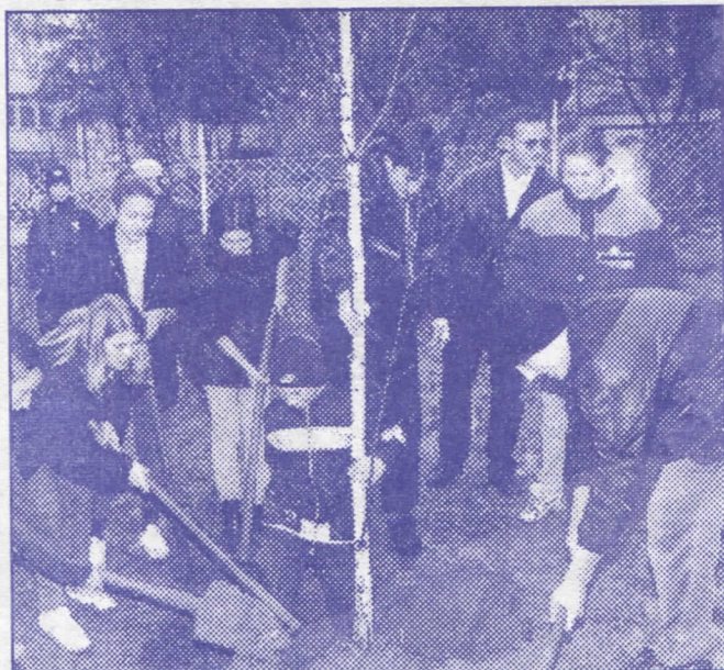
Оплемењавањем зелених површина новим садницама, општина Земун је допринела очувању и заштити животне средине

– у месној заједници "19. септембар" урадићемо тротоаре са леве и десне стране пута у улици Колубарски пут од броја 1 до краја,