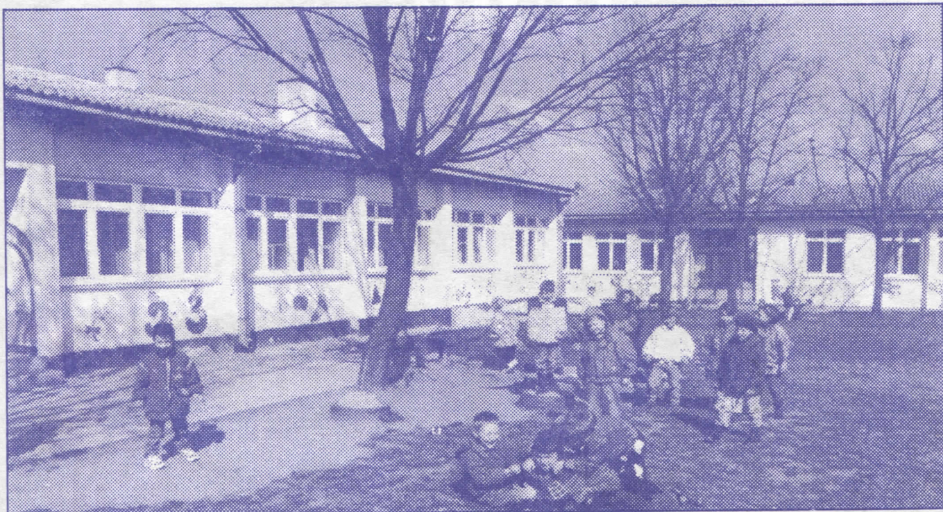
У Земуну су општинским новцем реновирали вртићи и школе

Српска радикална странка има људе који ће, зарад грађана, учествовати у овом подухвату. Уз нашу помоћ, ваши проблеми ће се решавати, а досадашња пракса "празних обећања" постаће део ружне прошлости.